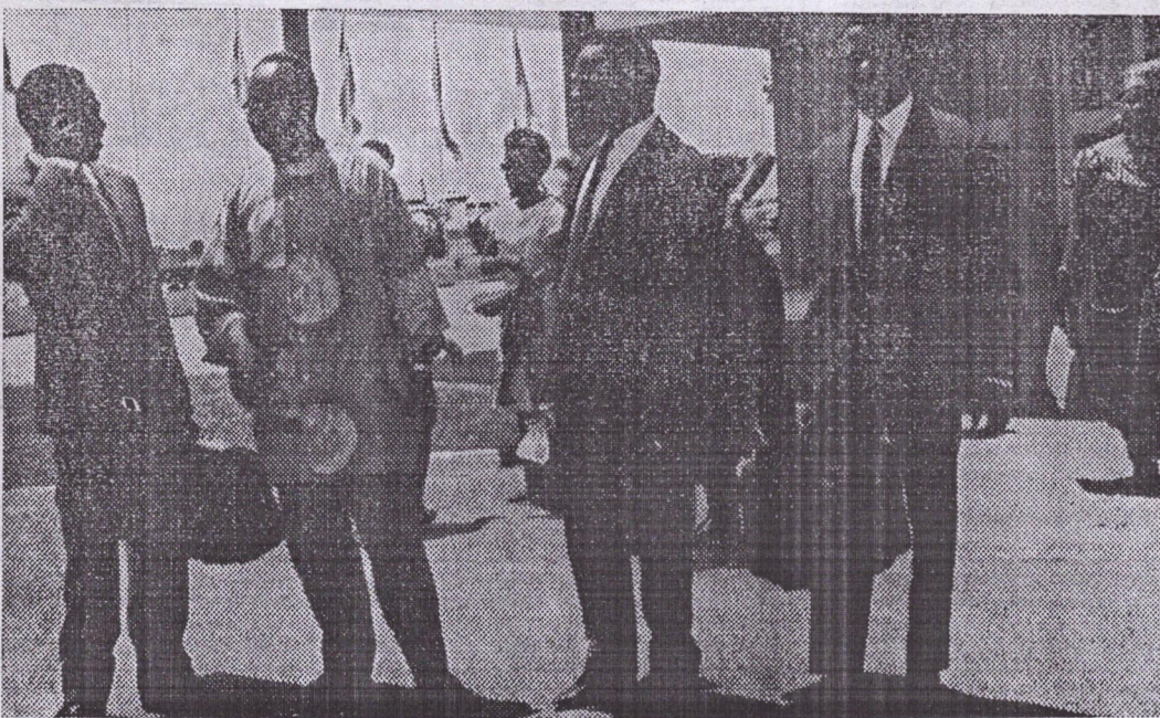
L'arrivée des délégations à Dar-Es-Salam où s'est déroulé du 2 au 6 décembre le congrès de l'USPA.

— Salue le courage et la volonté inébranlable de libération des nationalistes de l'Angola, du Mozambique, de la Guinée dite portugaise et des Iles du Cap Vert et leur réaf-